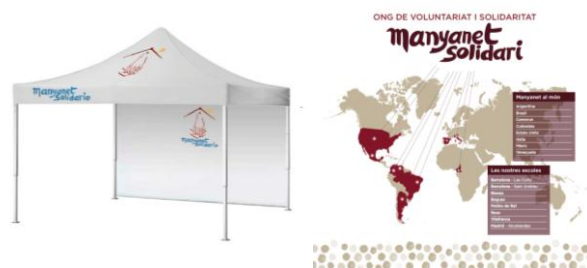
Carpa de Manyanet solidario

Para la campaña de este año se decidió apostar por renovar el material que teníamos y se optó por comprar una carpa con su ventana solidaria junto a los trípticos para hacernos presentes en las ferias. Se hicieron camisetas nuevas para divulgar la ONG y se dio a todos los alumnos y familias lápices y bolis especiales para animar a financiar nuestros proyectos.