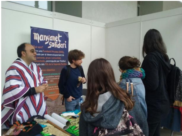
Universidad Pompeu Fabra

Participamos en tres ferias de asociaciones en Barcelona, en octubre en la universidad Pompeu Fabra, en febrero en Molins de Rei y en mayo en Vilafranca del Penedés.