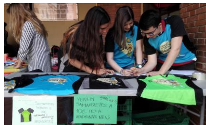
Venta de camisetas solidarias