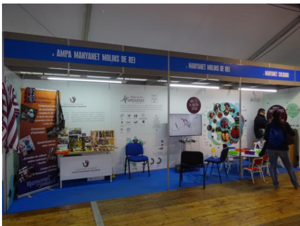
Molins de Rei