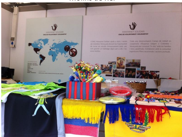
Vilafranca del Penedés